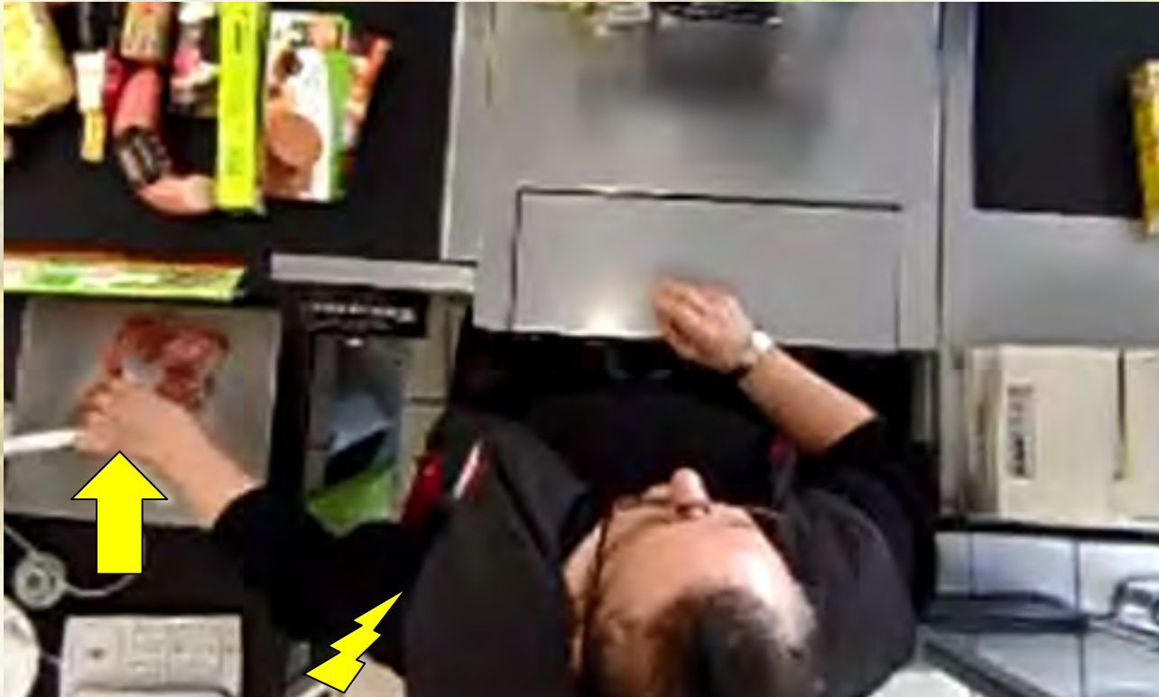
Pesage à gauche

Le pesage F & LEG crée des contraintes pour l'épaule gauche (rotation externe)